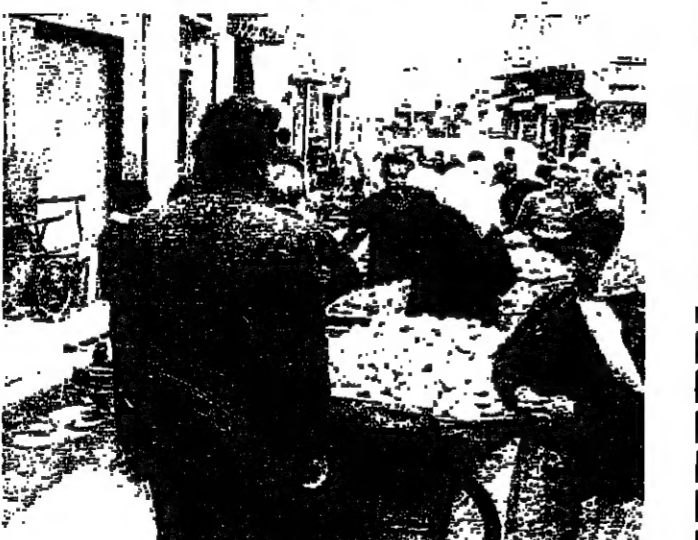
بسطات الخضار في احد شوارع صيدا الرئيسية ■